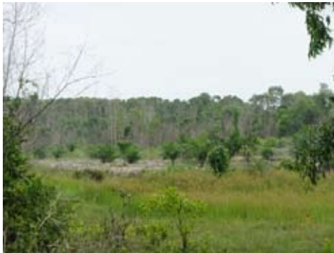
ภาพประกอบ 3 ป่าเสม็ดที่อยู่ติดกับแปลงนาและสวนปาล์มของตำบลควนโลง อำเภอควนเนียง จังหวัดสงขลา

แม้ไม่มีเอกสารสิทธิ์ใดๆ เป็นลายลักษณ์อักษรในการแสดงความเป็นเจ้าของ แต่ทุกคนในชุมชนยอมรับกติกาที่ร่วมกัน ทำให้เห็นว่าชุมชนดูแลรักษาป่าได้เป็นอย่างดี เพราะป่าเปรียบเสมือนจิตวิญญาณของชุมชน