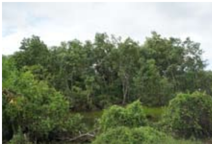
ภาพประกอบ 1 ต้นเสม็ด บริเวณป่าเสม็ดทุ่งบางนกออก หมู่ที่ 11 บ้านบ่อหว่า ตำบลควนโส อำเภอกวนเนียง จังหวัดสงขลา ที่มา: ถ่ายโดยผู้วิจัย วันที่ 22 มกราคม 2556

ชุมชนควนโส อำเภอกวนเนียง จังหวัดสงขลา มีวิถีชีวิตที่เรียบง่าย ตั้งบ้านเรือนใกล้กับแหล่งทรัพยากรธรรมชาติ คนในชุมชนส่วนใหญ่ประกอบอาชีพประมงขนาดเล็ก ทำนา และทำสวนยางพารา ทรัพยากรที่สำคัญของชุมชนประกอบด้วยแหล่งน้ำติดทะเลสาบสงขลาและป่าเสม็ดทุ่งบางนกออก (อุทัย ปริญญาสุทธินันท์, 2555, น. 13) ซึ่งมีลักษณะเป็นป่าพรุที่อุดมสมบูรณ์ที่สุดในจังหวัดสงขลา (ดูภาพประกอบ 1-2) มีพื้นที่ประมาณ 6,250 ไร่ ครอบคลุมพื้นที่ 5 หมู่บ้าน ได้แก่ หมู่ที่ 5 บ้านปากจำ หมู่ที่ 6 บ้านกลาง หมู่ที่ 8 บ้านสวน หมู่ที่ 10 บ้านใต้ และหมู่ที่ 11 บ้านบ่อหว่า ชุมชนมีความรู้สึกที่ตนเป็นเจ้าของป่าร่วมกัน พึ่งพาความอุดมสมบูรณ์ของทรัพยากรธรรมชาติในการดำรงชีวิต และใช้ประโยชน์ได้ตามความต้องการของแต่ละบุคคล (สัญญา พาทุมนันโต, สัมภาษณ์วันที่ 15 พฤศจิกายน 2555)