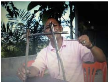
ภาพประกอบ 6 ฟังกาดจำลอง นำไม้กระถินมาทำคาน แล้วตัดกิ่งไม้ใบไม้มาสุ่มเป็นร่มเงาให้แก่ผึ้งในการทำรัง

ปัจจุบันชุมชนใช้ป่าเสม็ดเป็นแหล่งอาหาร พืชพาดลาดน้อยลง ทำให้ช่วยลดค่าใช้จ่ายในชีวิตประจำวัน เพราะป่าเสม็ดเปรียบเสมือนร้านค้าตามธรรมชาติที่ชุมชนไม่ต้องใช้เงินซื้อ เพียงเข้าไปในป่าจะพบกับแหล่งอาหารหลากหลายที่มีอยู่มากมาย แบ่งออกเป็น ประเภทพืช อาทิ เห็ดตับเต่า เห็ดเสม็ด เห็ดแครง ยอดเสม็ด ดอกเสม็ด ผักหวานป่า พืชผักพื้นเมืองอื่นๆ ประเภทสัตว์ อาทิ ไช้หมดแดง ฟิ่งป่า ตะกวด เลือปลา เขี้ยว ไก่ป่า ชะมด นกเป็ดน้ำ ลิงแสม นาก นกคุ่ม นกอีลุ้ม และปลาน้ำจืดต่างๆ เช่น ปลาหมอ ปลาช่อน ปลาชะโด ปลาเนื้ออ่อน ปลาตะเพียน ปลากระดี่ ฯลฯ และยังใช้ในการประกอบอาชีพหารายได้ให้ชุมชน ได้แก่ การเลี้ยงผึ้งหลวง วิธีเลี้ยงของชุมชนแห่งนี้เลี้ยงโดยฟังกาด เนื่องจากดอกเสม็ดจะบานในช่วงเดือนมิถุนายนถึงเดือนมีนาคมของปีถัดไป ฟิ่งหลวงจะอพยพมาจากภูเขาในตำบลเขาพระ อำเภอรัตนภูมิ จังหวัดสงขลา ซึ่งฟังกาด (ดูภาพประกอบ 6) เป็นภูมิปัญญาชาวบ้าน สร้างจากการนำไม้ 3 ท่อน ใช้ทำเสา 2 ท่อน ทำคาน 1 ท่อน โดยเสาทั้ง 2 ท่อน สูงต่ำไม่เท่ากัน ต้นหนึ่งสูง ต้นหนึ่งต่ำ แต่มีความสูงเหนือศีรษะขึ้นไป ส่วนไม้คานนั้นยาวประมาณศอก ไม้ที่ทำคานนั้นต้องเป็นไม้เนื้อเย็น โดยเฉพาะกระถินฝิ่งชอบมาก เมื่อทำคานเสร็จแล้วตัดกิ่งไม้ ใบไม้ มาสุ่มเป็นร่มเงาให้แก่ผึ้งในการทำรัง (อินดี หนูบวช, 2554, น. 45) ผู้ที่ฟังกาดต้องดูทิศทางลม และสภาพอากาศ และภูมิปัญญาอีกอย่างหนึ่งในการจับผึ้ง คือ การใช้ควันไฟไล่ผึ้งออกจากรัง โดยไม่จุดไฟเผารังเหมือนที่อื่น รังผึ้ง 1 รัง ให้นำน้ำผึ้ง 10-20 ขวด ราคาขวดละ 300-400 บาท สร้างรายได้เสริมให้แก่ชุมชนเป็นอย่างมาก รวมถึงการเก็บเห็ด การตัดไม้เสม็ดทำกระชังเลี้ยงปลากระพง ทำเครื่องมือประมงพื้นบ้าน และการตัดฟืน เป็นต้น